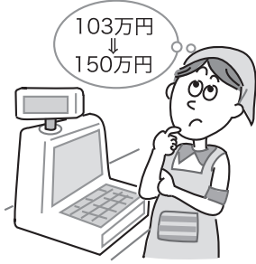
(図表1) 配偶者控除額

主な項目の適用時期は、次頁表のとおりです。 なお、前年以前の改正で適用時期が今年以降となる項目も記載しています。